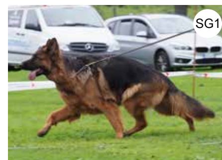
JKL Hündin | Chienne