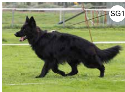
JKL Rüde | Masculin