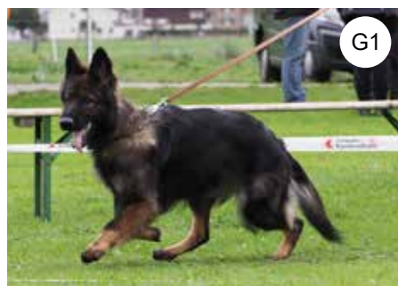
JHKL Hündin | Chienne